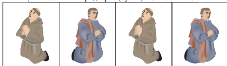
Трудовой (молящийся от безделья) народ

Таймазинская придворная (кухня) - большая концентрация "красных девиц". Здесь царят сплетни, интриги и рождаются заговоры.