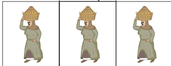
Таймазинская придворная (кухня) - Святое место

Царь Александр IV Суровый, но Справедливый - учреждает законы, вершит суд над провинившимися, посылает, обливает, выливает (ведра воды в постель, водку за окно).